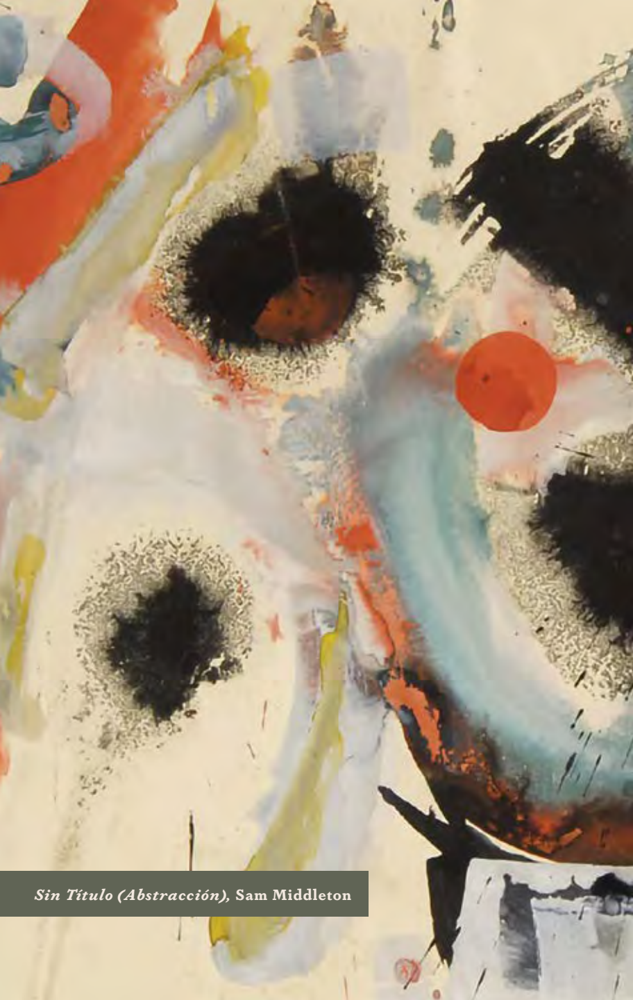
Sin Título (Abstracción), Sam Middleton