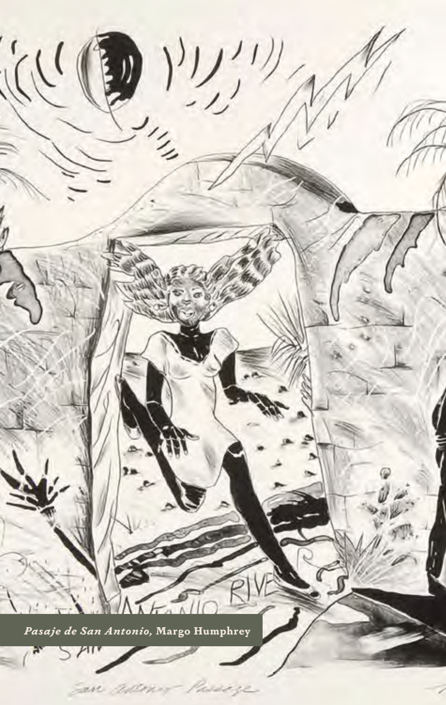
Pasaje de San Antonio, Margo Humphrey