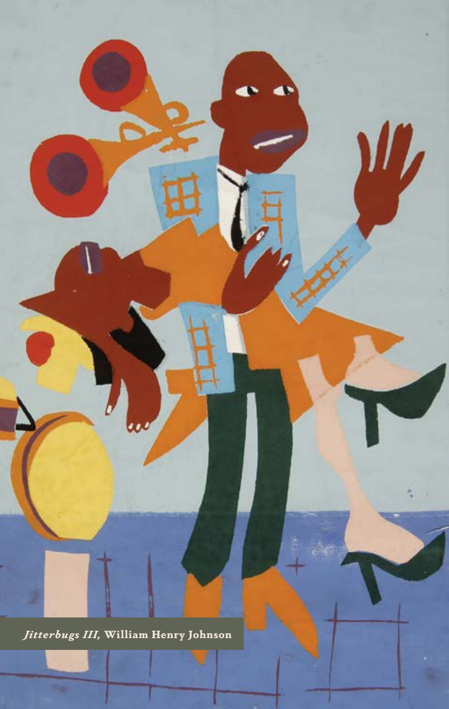
Jitterbugs III , William Henry Johnson